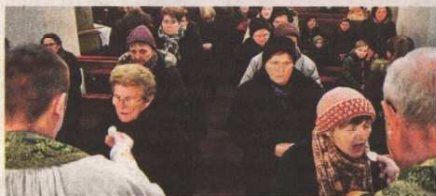
Desetak posto stanovništva dolazi na euharistiju