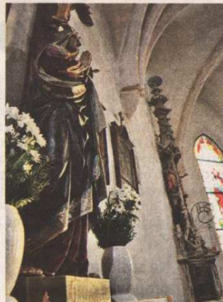
Vrijedan detalj u crkvi - kustodija visoka 6 metara