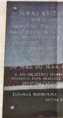
Među župnike u Nedelišću upisao se...