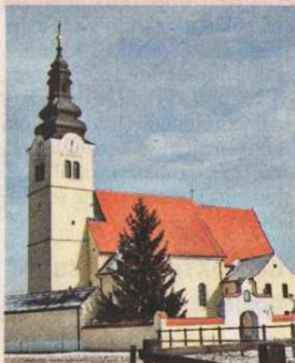
Župa crkva u Nedelišću